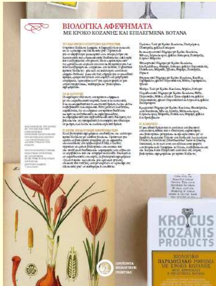
PREVENTION Οκτωβρίου 2010