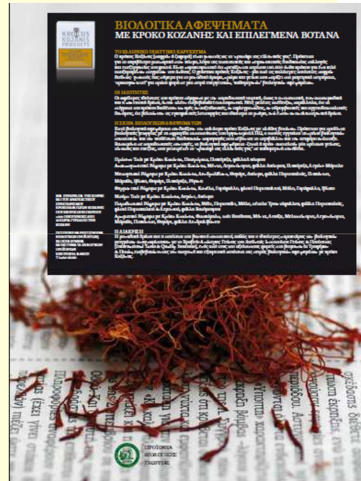
Men's Health Οκτωβρίου 2010