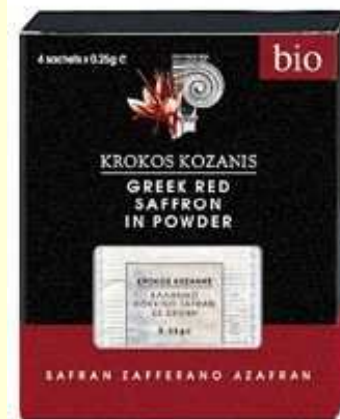
1 γρ. Βιολογικός κρόκος σε σκόνη (φακελάκια 0,25 γρ X 4 τεμ.)