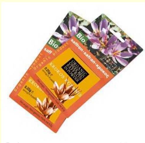
0,25 γρ. Βιολογικός κρόκος σε στίγματα - blister