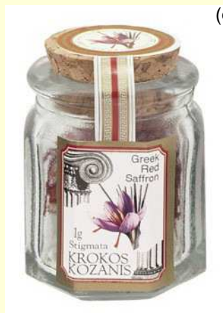
1 γρ. Συμβατικός κρόκος σε στίγματα σε γυάλινο βαζάκι