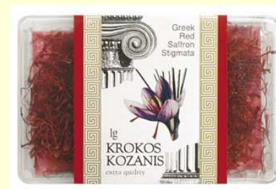
1 γρ. Συμβατικός κρόκος σε στίγματα – πλαστικό κουτί